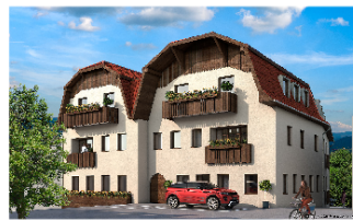
Stadthaus Altmünster: Frontansicht (Rendering)

Gemeinsam mit einer privaten Investorengruppe und Vertriebspartner ÖKO Wohnbau konnte im oberösterreichischen Altmünster ein weiteres Wohnen-am-Puls-Juwel erfolgreich fertiggestellt und am 28. September feierlich an die Mieter übergeben werden. Das aufwendig sanierte, historische Haus mit insgesamt 19 barrierefreien Wohnungen mit vollausgestatteten Küchen und Größen von ca. 30 bis ca. 100 m 2 bietet Wohnkomfort nach neuestem Stand der Technik. „Wir konnten hier in Altmünster einen sehr schönen Altbestand mit Charakter zu modernem, stilvollem Wohnraum für Jung und Alt umwandeln – das Ergebnis kann sich wirklich sehen lassen. Das Haus ist bei Übergabe vollkommen ausvermietet, ein großer Erfolg.“, freut sich Thomas Müller, Projektleiter und Geschäftsführer der Silver Living Development GmbH, einem Unternehmen der Silver Living Gruppe.